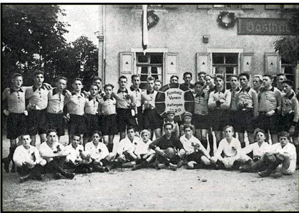
1925 vor dem damaligen Vereinslokal Krone Haltingen.

In der denkwürdigen Versammlung am 28. Mai 1925 begann für den Verein ein neuer Lebensabschnitt. Es konnte erreicht werden, dass der alte Sportplatz von der Gemeinde unentgeltlich dem Verein wieder zur Verfügung gestellt wurde und mit Begeisterung nahmen die Aktiven wieder den Spielbetrieb auf.