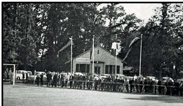
Sicht auf das Vereinsheim, Sportplatz-Einweihung 1965

Ein weiterer Erfolg konnte im Jahr 1967/68 verbucht werden. Unsere 1. Mannschaft konnte den Titel in der B-Klasse gewinnen und schaffte somit den Aufstieg in die A-Klasse.