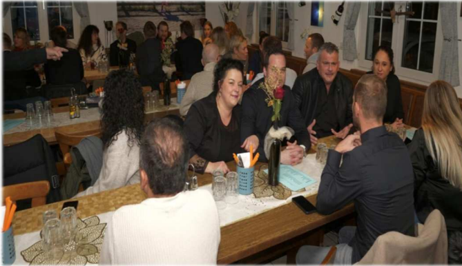
Gemütliches Beisammen sein und rätseln beim 'Weihnachtsquiz'