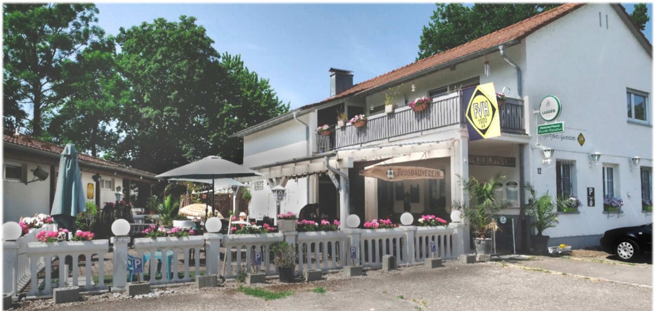
Das Vereinsheim aktuell mit neuem Vordach, neuem Anstrich und Gartenwirtschaft